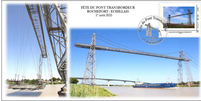
Carte postale longue 21 x 10