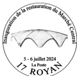
Timbre à date temporaire illustré

Inauguration officielle reportée au 15 juillet 2024