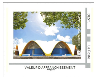
Le Marché central de Royan Projet du timbre en émission limitée